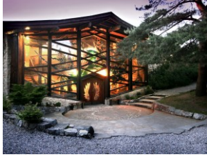
スコットランド フィンドホーン